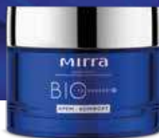
Крем-комфорт арт. 3361 / 50 мл / 995 ₽

Бальзам-эксперт можно назвать настоящим спасательным кругом для кожи: он восстанавливает состояние равновесия кожи и стабилизирует ее адаптивный потенциал. Все компоненты средства в комплексе способствуют восстановлению барьерных функций кожи, процессу питания клеток, избавления их от шлаков, ингибируют перекисное окисление липидов, увлажняют, питают и успокаивают кожу. Бальзам поддерживает естественный механизм обновления клеток, нормализует метаболизм кожи, повышает стрессоустойчивость, иммунный и адаптивный потенциал, снижает реактивность, оказывает направленное успокаивающее действие, способствует улучшению рельефа кожи.