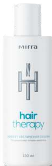
Кондиционер-ополаскиватель для волос арт. 3131 / 150 мл / 429 ₽

Гидролизированный кератин и протеины сладкого люпина, пшеницы, ржи, овса в комбинации с биоактивным аминокислотным комплексом мгновенно заполняют дефекты поврежденной кутикулы волоса, сглаживают чешуйки, обеспечивают зеркальную гладкость, эластичность и блеск без утяжеления. Спрей защищает от механических (сушка, завивка, выпрямление, термическое воздействие) и химических (окрашивание) повреждений волос, а также от неблагоприятных факторов окружающей среды.