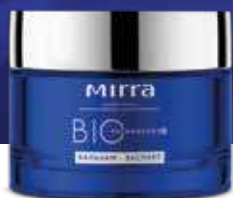
Бальзам-эксперт арт. 3362 / 50 мл / 995 ₽

Линия MIRRA BIOTECHNOLOGY — экспертный подход к сохранению молодости. Глубокое увлажнение, активизация защитных механизмов, повышение упругости и эластичности — «три кита» действия этой линии. Средства прекрасно питают кожу, защищают от свободных радикалов, которые вызывают преждевременное старение. Уникальные биокомплексы стимулируют выработку коллагена, улучшают структурный каркас кожи, сокращают количество морщин.