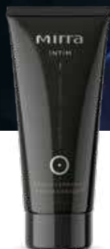
Гель-лубрикант увлажняющий арт. 3200 / 30 мл / 498 ₽

Уникальная композиция полисахаридов плауна, белой лилии и D-пантенола повышает эластичность и тургор тканей, устраняет ощущение сухости. Масло иланг-иланга – эффективный афродизиак для мужчин и для женщин – снимает раздражительность и беспокойство, увеличивает половое влечение, возвращает уверенность в себе. Аргинин усиливает кровоснабжение органов половой сферы, концентрат бактериофагов нормализует микрофлору половых путей, избирательно уничтожая патогенные микроорганизмы.