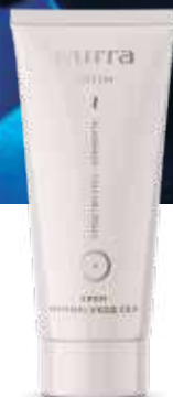
Крем-уход Ева арт. 3367 / 30 мл / 498 ₽

Натуральные компоненты (трипептиды) восстанавливают и укрепляют структурно-механические функции тканей интимной зоны. L-аргинин и изокверцетин улучшают кровообращение и укрепляют стенки сосудов, способствуя лучшему кровонаполнению половых органов. Растительные масла и экстракты, протеины злаков, витамин Е и глутаминовая кислота обеспечивают полноценный уход за кожей и слизистыми. Бальзам способствует повышению сексуальной чувствительности обоих партнеров.