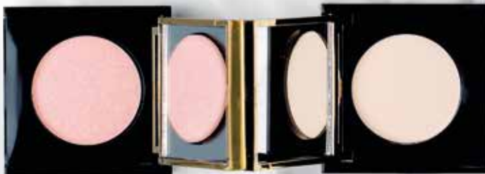
Розовый кварц арт. 53204 / 2 г / 399 ₺