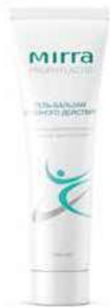
Гель-бальзам двойного действия арт. 98134 / 100 мл / 498 ₺

Аромакомпозиция «Иммунитет» от MIRRA создает особый щит из эфирных масел, который помогает справиться с болезнетворными бактериями и вирусами. Аромакомпозицию можно наносить на кожу, окружая себя приятным ароматом, защищающим вас от бактерий и вирусов, а можно использовать для аромалампы, чтобы насытить полезными летучими веществами помещение и оздоровить организм во время отдыха. Или, например, добавить в воду во время горячей ванны, чтобы согреться и повысить иммунитет.