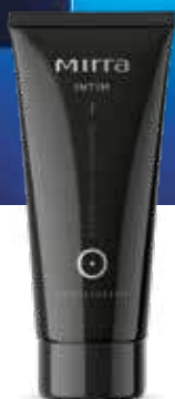
Секс-бальзам арт. 3366 / 30 мл / 498 ₽

Уникальная композиция полисахаридов плауна, белой лилии и D-пантенола повышает эластичность и тургор тканей, устраняет ощущение сухости. Масло иланг-иланга – эффективный афродизиак для мужчин и для женщин – снимает раздражительность и беспокойство, увеличивает половое влечение, возвращает уверенность в себе. Аргинин усиливает кровоснабжение органов половой сферы, концентрат бактериофагов нормализует микрофлору половых путей, избирательно уничтожая патогенные микроорганизмы.