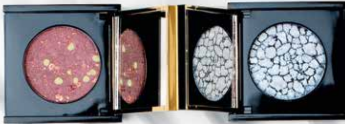
Бурлеск арт. 53277 / 2 г / 399 ₺

Состав, обогащенный витамином E, не сушит кожу. Тонкая текстура и насыщенные пигменты создают живой многогранный цвет на веках. Тени легко растушевываются и остаются стойкими в течение 12 часов после нанесения.