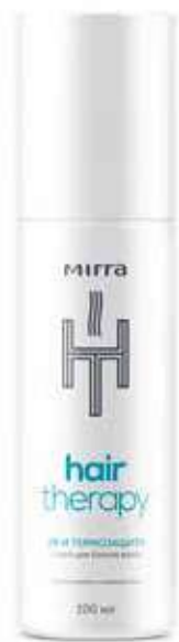
Спрей для блеска волос УФ- и термозащита арт. 3375 / 100 мл / 399 ₽

Гидролизированный кератин и протеины сладкого люпина, пшеницы, ржи, овса в комбинации с биоактивным аминокислотным комплексом мгновенно заполняют дефекты поврежденной кутикулы волоса, сглаживают чешуйки, обеспечивают зеркальную гладкость, эластичность и блеск без утяжеления. Спрей защищает от механических (сушка, завивка, выпрямление, термическое воздействие) и химических (окрашивание) повреждений волос, а также от неблагоприятных факторов окружающей среды.