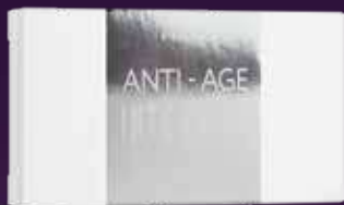
Сыворотка-бустер с гиалуроновой кислотой арт. 98140 / 15*1.5 мл / 1799 ₺

Низкомолекулярная гиалуроновая кислота проникает в глубокие слои кожи и активирует естественные процессы выработки собственного коллагена и других структурных молекул. Высокомолекулярная форма кислоты длительно удерживает влагу, препятствуя обезвоживанию кожи. Биофитозэкстракты, гидролизованный коллаген и трегалоза усиливают увлажняющий эффект, надежно защищают клетки от агрессивных внешних воздействий.