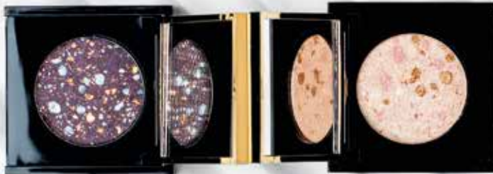
Иллюзия луны арт. 53201 / 2 г / 399 ₺