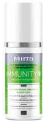
Иммуностимулирующий крем IMMUNITY+ арт. 98125 / 50 мл / 498 ₺

Служит профилактикой заболеваний опорно-двигательного аппарата, восстанавливает подвижность суставов. Обладает мгновенным охлаждающе-разогревающим действием: ментол охладит и снимет отечность тканей, разогревающее действие камфоры устранил болевой синдром.