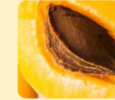
Масло абрикосовой косточки