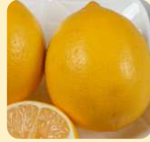
Масло цедры лимона

Комплекс 6 масел, богатых полиненасыщенными жирными кислотами, обеспечивает глубокое увлажнение и питание кожи вокруг ногтей. Масло укрепляет зону кутикулы, способствуя её эластичности и защищая от появления заусенцев.