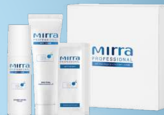
СИСТЕМА УХОДА ФРУТ-ЭНЗИМ арт. 4050 | 15 процедур 2199 руб.

Атравматическая чистка – бережно и эффективно!