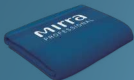
ПОЛОТЕНЦЕ МАХРОВОЕ MIRRA PROFESSIONAL арт. 9906178 | 50 x 90 см 799 руб.