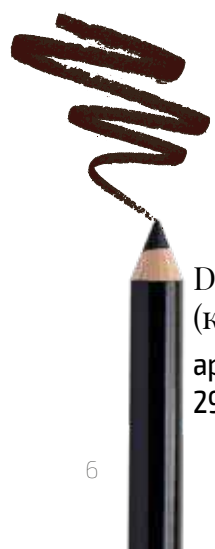
Dark chocolate (коричневый) арт. 53304 299 Р

Карандаши имеют особо пигментированную текстуру, легко растушевываются, комфортны в нанесении.