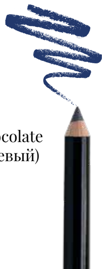
Dark night (синий)* арт. 53303 299 Р

*рекомендован визажистами для создания smoky eyes